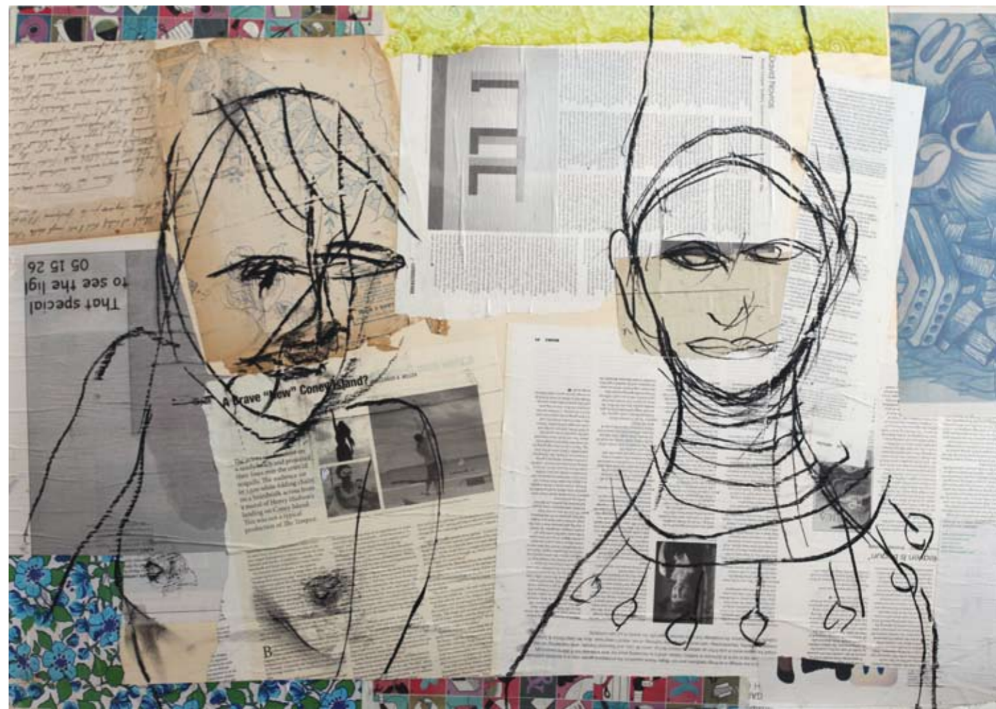
In questa pagina: Chic + chic, 70 x 100 cm